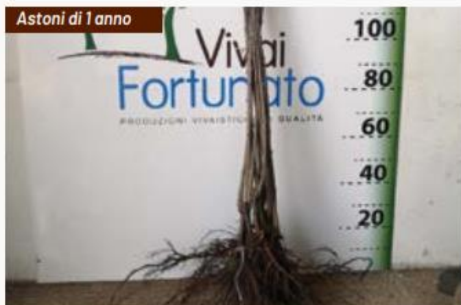
Astoni di 1 anno